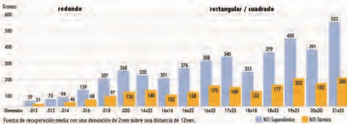
Fuerza de recuperación de los arcos Ni-Ti Superelásticos comparado al Ni-Ti térmico

Fuerza de recuperación media con una desviación de 2mm sobre una distancia de 12mm.