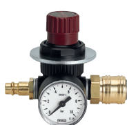
Reductor de presión