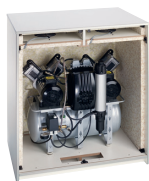
Armario insonorizado grande