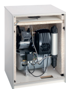
Armario insonorizado pequeño