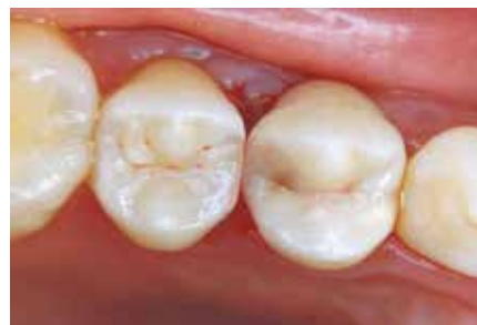
La restauración con Polofil Supra, ya acabada