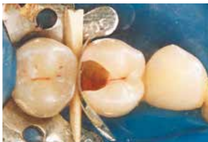
Después de la preparación