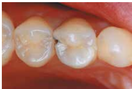
Situación de partida